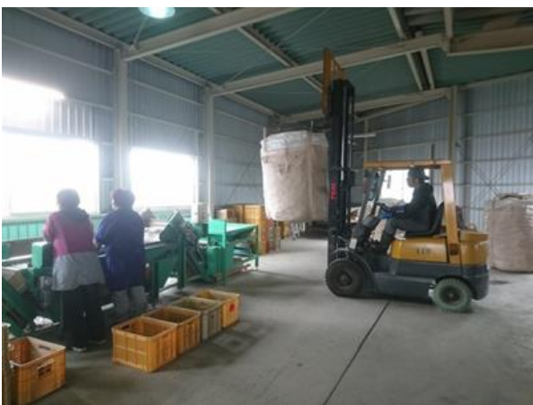
出荷調整一貫作業機への搬入

規模拡大に伴い、既存の倉庫では手狭になった。サトイモ調整を手作業や根切り機だけでは追いつかないため、新たに倉庫の新築と出荷調整一貫作業機を導入するなど、作業の効率化や労働時間の短縮に努めています。