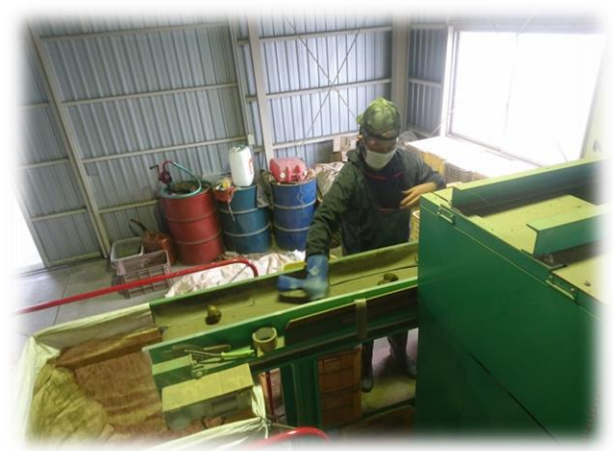
出荷調整一貫作業機を使った作業