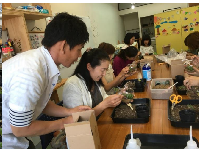
多肉植物の寄せ植え教室