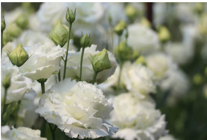
高品質なトルコギキョウ栽培

私の栽培したこだわりの花を見て、多くの人が幸せを感じられるような花づくりを目指しています。