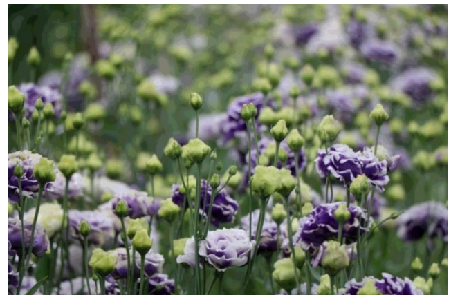
撮影したトルコギキョウ