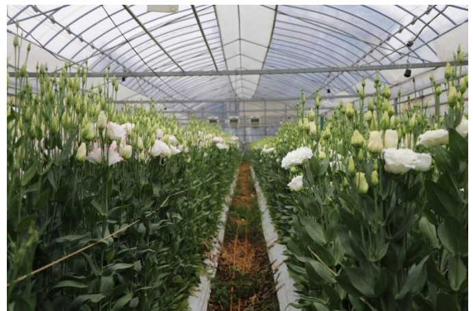
トルコギキョウのハウス