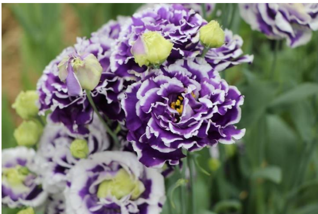
SNS用に撮影したトルコギキョウ