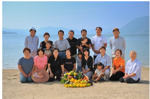
NPO 法人豊かな食の岩城農村塾