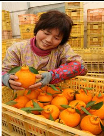
自慢の葉付きデコボン