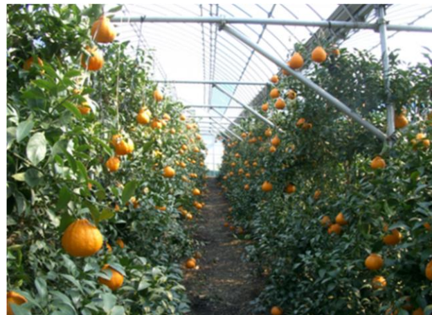
デコポンの収穫前