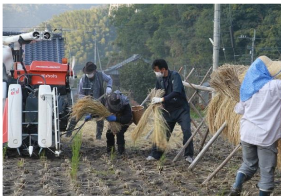
稲木米の脱穀作業

第3回全国すし米コンクールに出品して、自分の栽培したお米が美味しいことに気が付き、また、全国の様々なブランド化している優秀な方々に会い話を聞くうちに、味・安全性・品質を全て兼ね備えたお米は意外に少ないことが分かってきました。そこで、 自分でブランド化して販売 していこうと思いました。