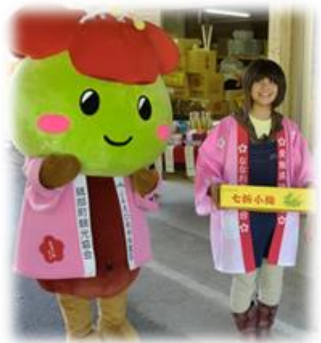
「ななうめちゃん」と梅PR

■頑張っている女性の農業者で繋がっていきましょう！ 一般的には、男性の1.2倍の作業時間がかかると言われていますが、梅は、比較的手間がかからないので、女性でも十分やっていけると思っています。自分がモデルケースとなって、もっと若い方が後に続いて欲しいなと思っています。また、若い女性農業者の方々とお会いして、お互いに頑張っている姿を見て励みにしたいと思っていますので、繋がっていきましょう！