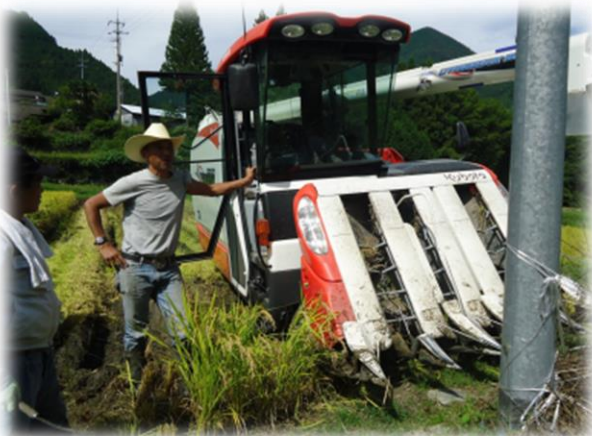
稲刈りの打ち合わせ

また、ある程度平準化した作業を心掛けていて、 冬場や雨のとき って、作業がないってことがよくあるんですが、従業員が作業できるように、加工品（ポン菓子など）の生産にも取り組んでいます。忙しいときだけの雇用では集まりにくいですから。あと、できるだけ「 日曜日は休みにしよう 」という取り組みもしています。