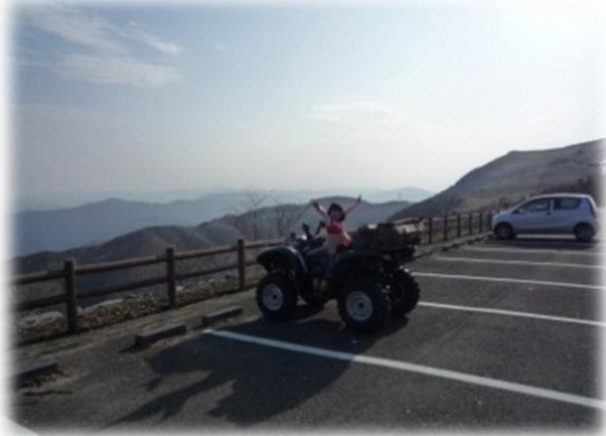
子どもとドライブ