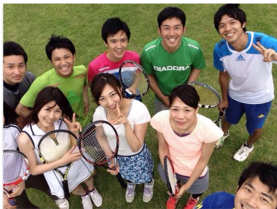
テニスサークルの仲間たちと