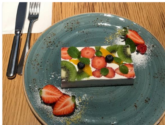
取引先に伺って食事