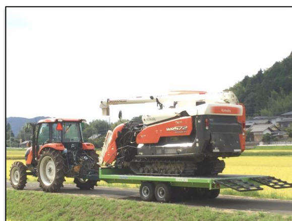
コンバインの牽引