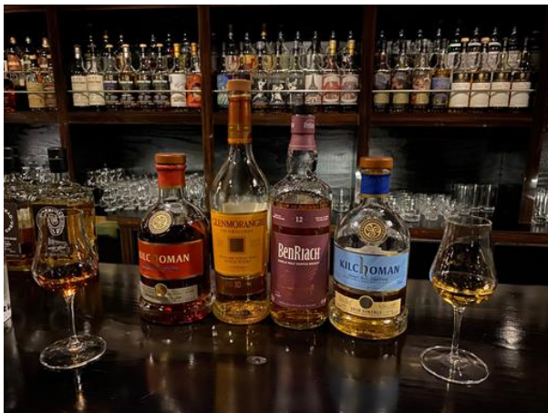
↑ 大好きなお酒でリフレッシュ！