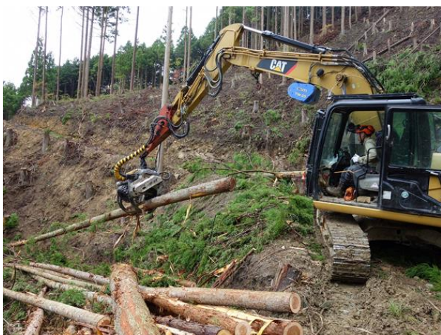
↑ 重機を使って木材を集材

現場は一つとして同じところがなく、施業をするのは難しいですが、そこでしっかりと計画を立てて自分の思う通りにできたときはとても達成感があります。