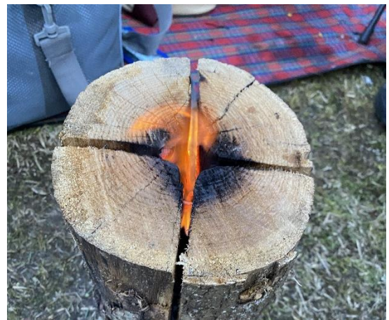
↑ スウェーデントーチを自作しました。