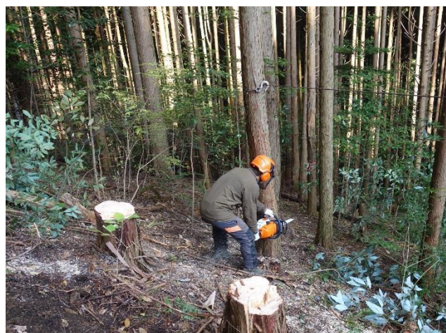
↑ チェンソーの扱いにも慣れてきました