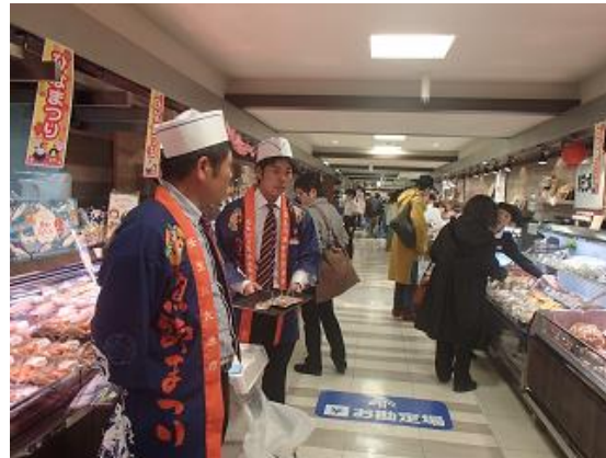
百貨店での販売促進活動（父親と）