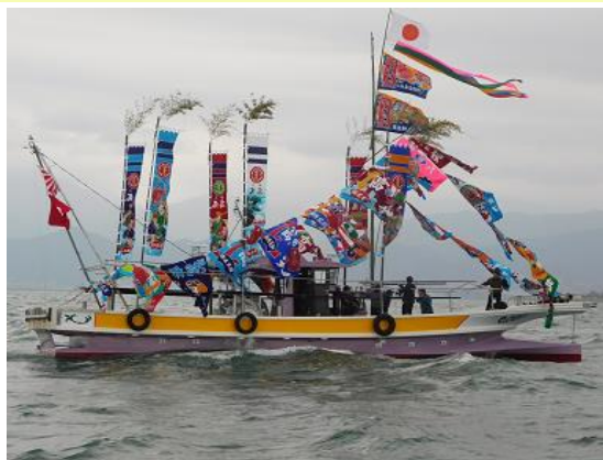
新造船（自己所有）の進水式

その一方で、資源の減少や魚価の低迷など、働いてみて初めて分かる漁業を取り巻く様々な課題も見えてきました。 こうした状況を乗り越え、将来に渡って長く漁業を続けるためにこれから何ができるか、日々考えながら海と向き合っています。