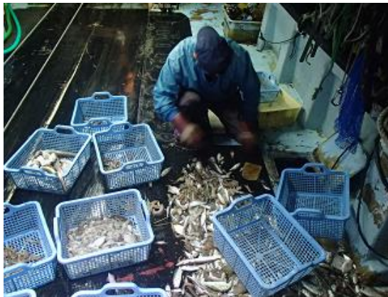
沖での漁獲物の選別作業