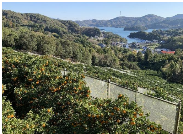
眺望の良い園地と御荘湾