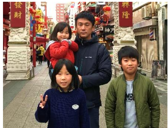
家族旅行で記念撮影！