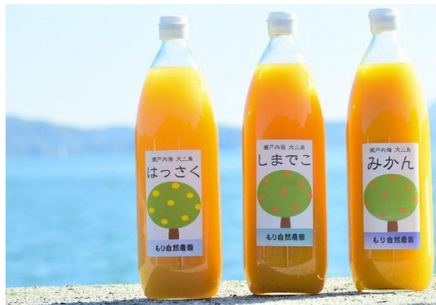
自慢の柑橘ジュース 3 種類