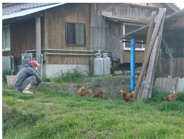
元気な平飼いの鶏たち