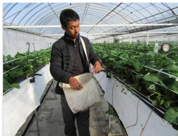
いちご管理状況、広い通路が目立ちます