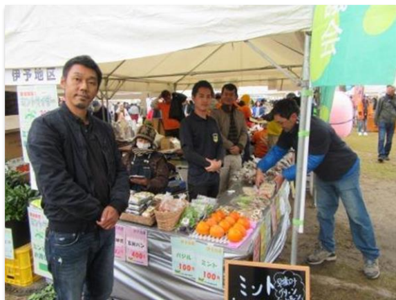
青年農業者仲間と諸行事参加