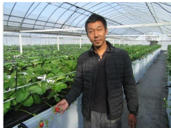
収穫間近となったいちご