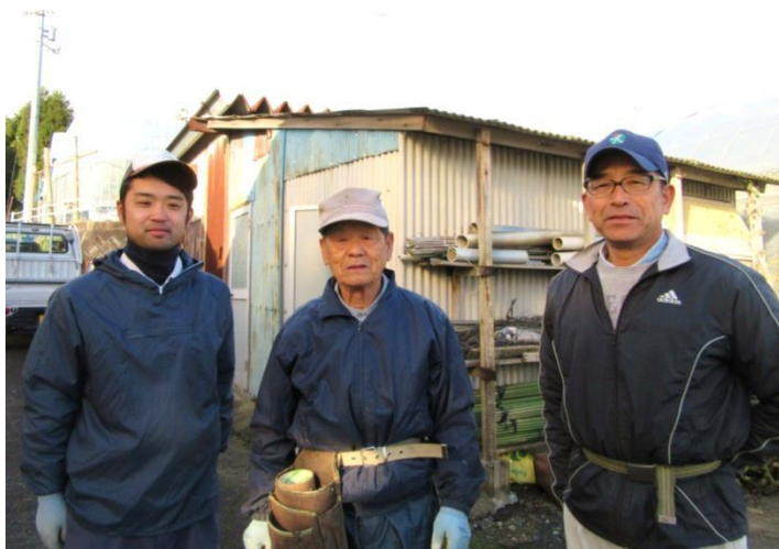
左から長男、父、本人