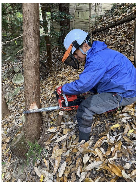
チェーンソーでの伐倒作業

現場を経験することで、作業に関して具体的に意見を出し合えますし、機械の故障等のアクシデントにも迅速に対応することができるのではないかなと思います。