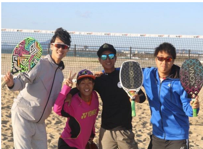
ビーチテニスの仲間たちと