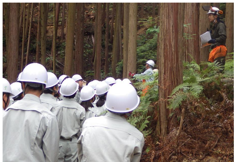
伊予農業高校生たちの現場研修