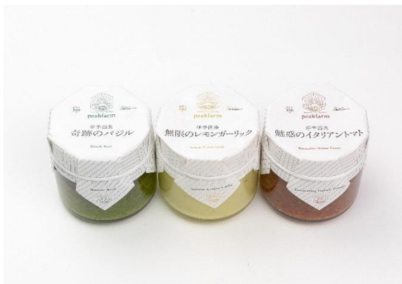
伊予西条イタリアンシリーズ