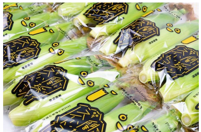
闇採り®スイートコーン