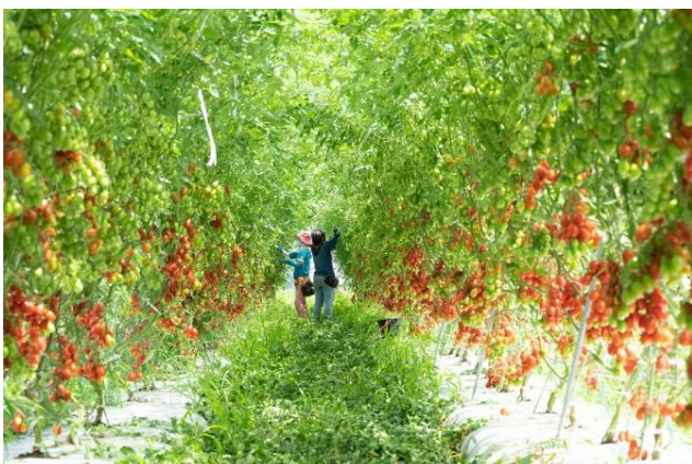
イタリアントマト収穫風景