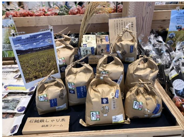
産直市で特別栽培米を販売