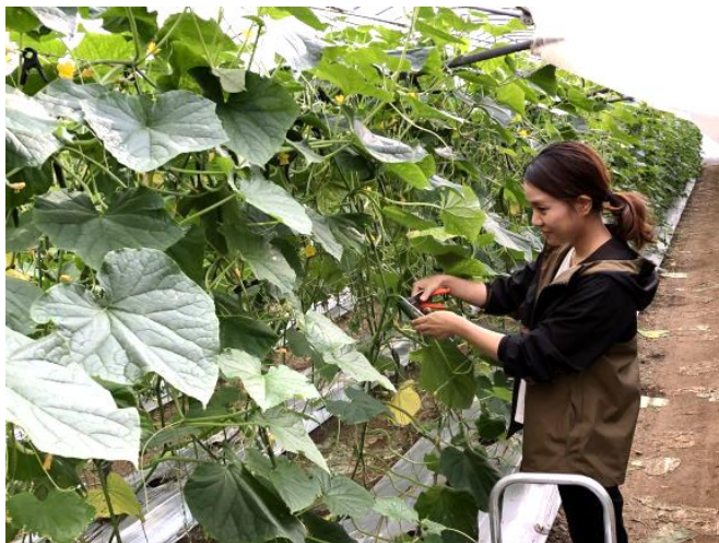
きゅうりの収穫作業

また、繁忙期の収穫作業は毎日になりますが、 定期的に販売額の入金があるため、1年を通して安定した収入 を得ることができます。