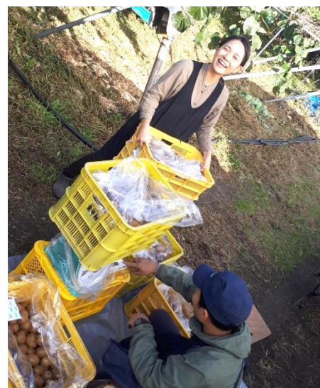
夫婦でキウイフルーツを収穫