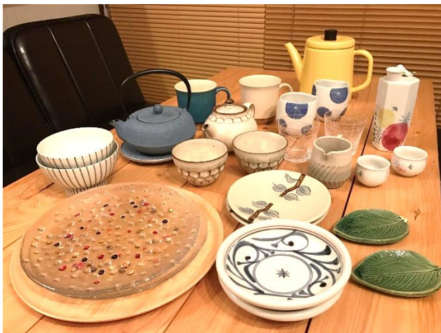
お気に入りの食器