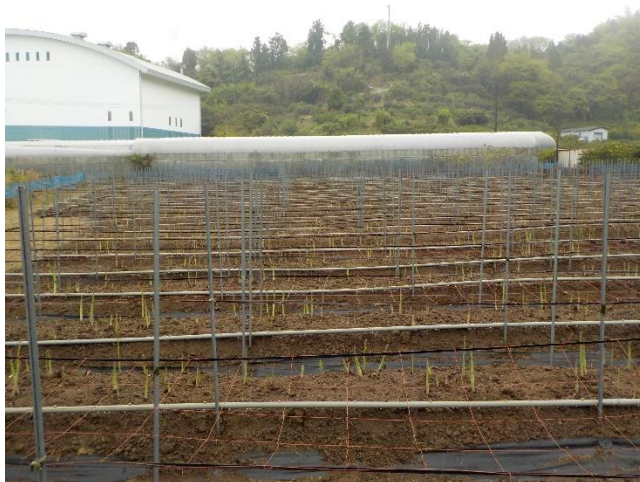
アスパラガスの露地栽培(5月上旬)

アスパラガスの栽培は、将来的には単価の高い 春採り(4～5月) のみにする計画です。