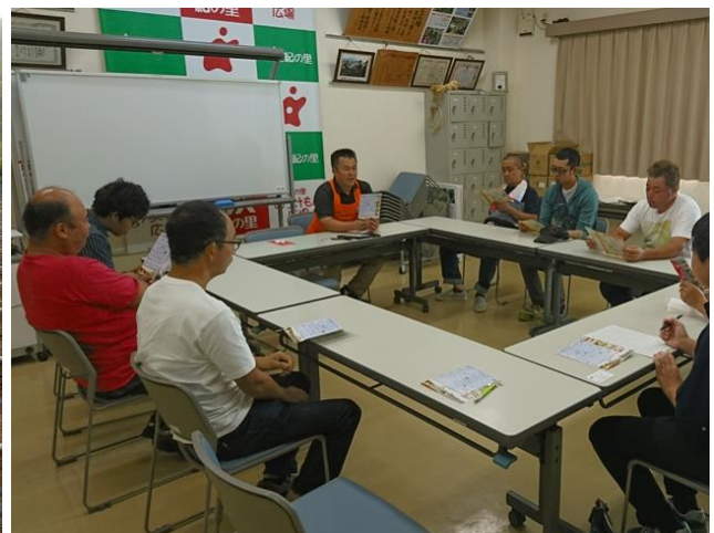
青年農業者の仲間と県外視察