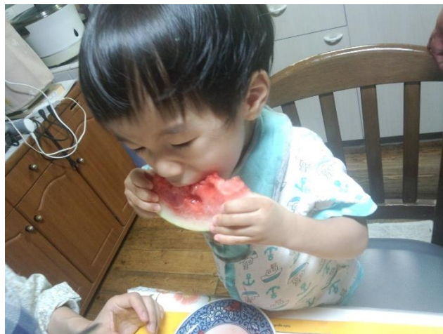
収穫したスイカを子供がパクリ