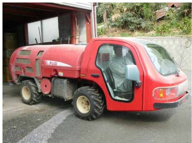
スピードスプレーヤで農薬散布準備