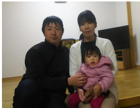
可愛い娘と仲よし奥さん