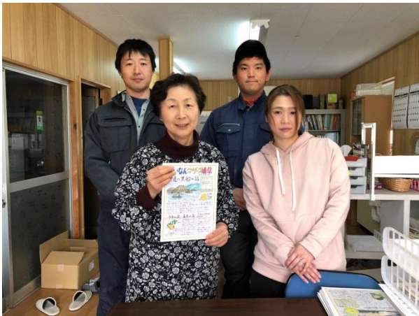
社長（母）及びスタッフと一緒に