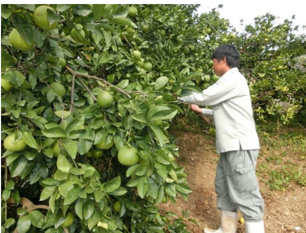
河内晩柑の収穫期判断

宅配や市場にも出荷できない果皮が汚れた河内晩柑を少しでもお客さんに食べてもらいたいという思いから、加工施設を建設し、菓子製造業許可を取得して河内晩柑を使ったジュレ作りを母親とともに推進し拡大していきました。