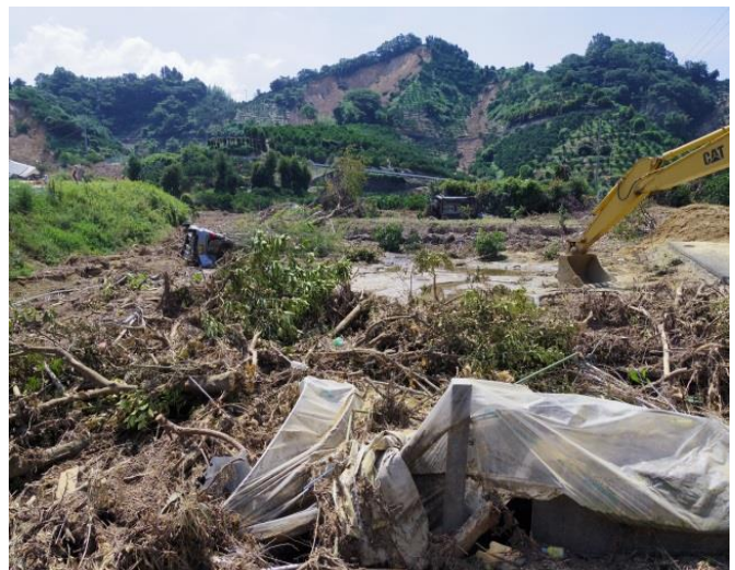
平成30年7月豪雨の被災状況