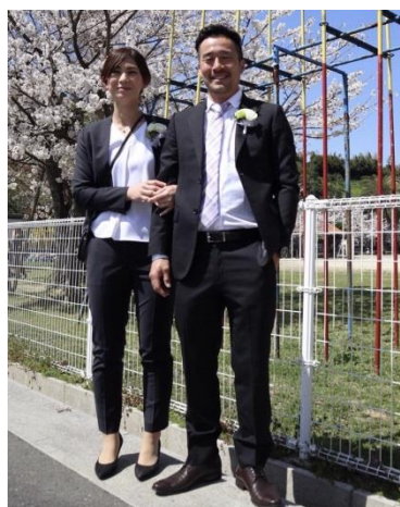
入学式も夫婦で出席！