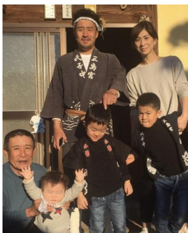
地域行事にも積極的に参加