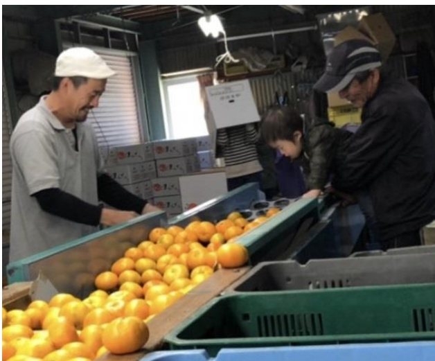
家族でみかんの選果作業地

結婚後は、主に産直部門はパートナー(妻)が担当して「みかん」を介した消費者交流に取り組んでいます。