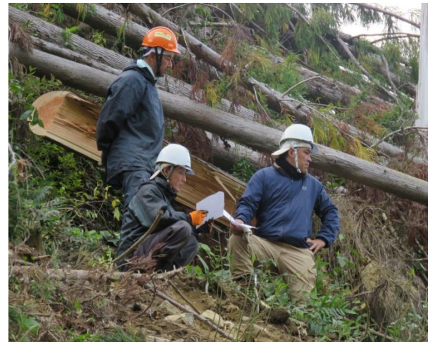
風倒木被害復旧作業を指示

林業の現場は、山によって地形も木の大きさも違いますし、いろんな意見を持った森林所有者がいます。一人一人を説得し、森林所有者の要望に応え、意見をまとめ森林整備に繋げていく過程で時には怒られる事もありますが、間伐を終えた山は見違える程綺麗で、「山がようになった、次もまた」と山主から褒められる度に次もまた頑張ろうという思いになります。