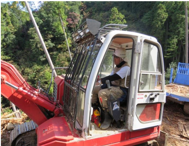
プロセッサを使い作業

熱意があれば森林所有者は、理解を示してくれます。話し合うことが重要です。私は、若い職員に日頃から「山主に会って話をしろ、顔を覚えてもらえ」と言っています。何でもいから、山主から「あいつは面白い」「あいつは釣りが好きなんじゃ」とか、仕事だけでなく私生活の話題で気安く話せる関係を作り、顔を覚えてもらうことが仕事をうまく進める上で必要ではないでしょうか。