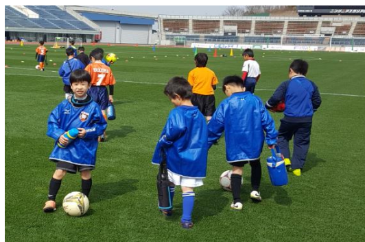
長男とサッカーの練習