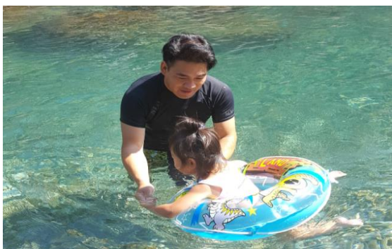
和歌山の川湯温泉にて川遊