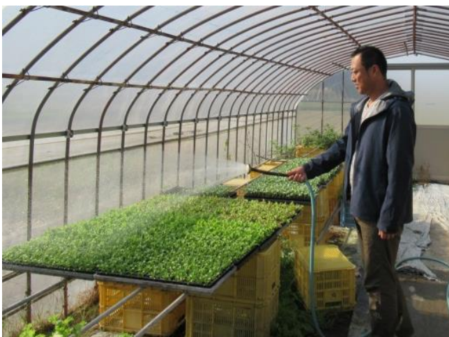
ハウスで育苗管理作業

常に2～3種類の作物を試作し、栽培管理方法・技術の確認と、消費動向を見ながら、次に生産出荷する作物を考えています。