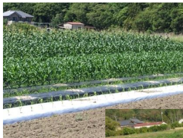
スイートコーンの圃場