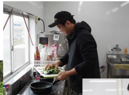
栽培した野菜で料理