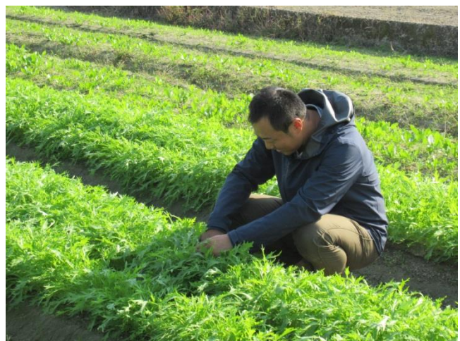
圃場で栽培管理作業