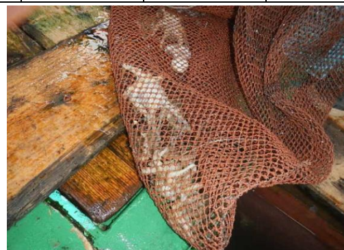
漁獲物のイタダク