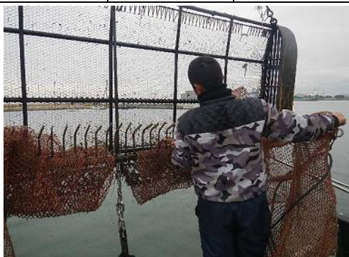
悪天候の日は漁具補修