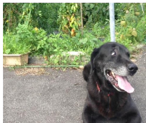
息抜きは愛犬との散歩