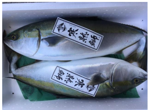
寒熟鰯（ブリ）の出荷