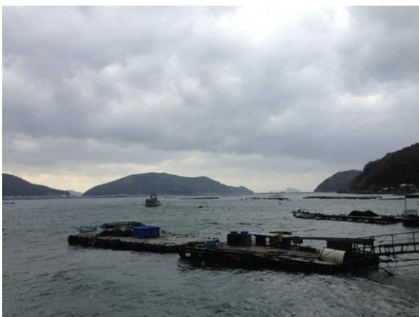
時には大シケの中出荷することもある

※生け罎：活魚を即殺・血抜きすること、神経抜き：脊椎の神経を取り除くこと 共に魚の品質をより長時間保持するための作業