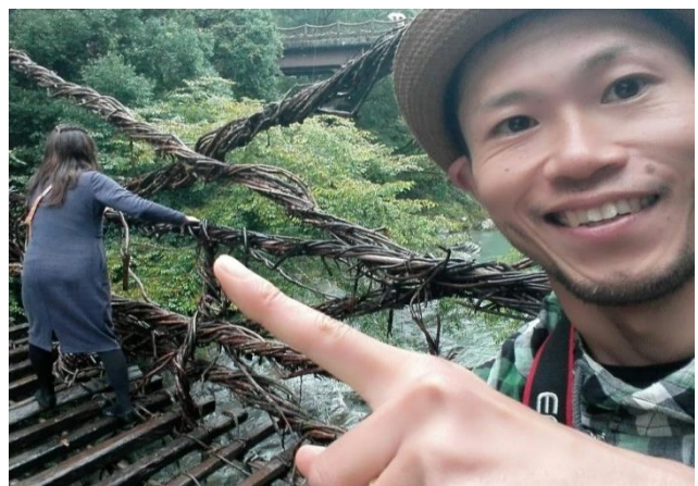
家族との充実した日々