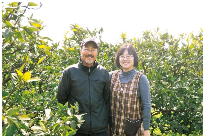
おしどり夫婦が職場（果樹園）で。マイペースで山仕事