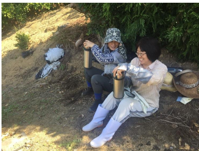
仲の良い隣の奥さんと休憩 雑談が弾みます

夫はJA職員、私は歯科技工士でしたが、家族と共に仕事ができる農業に取り組みました。皆で仲良く太陽の下で仕事に励んでいます。