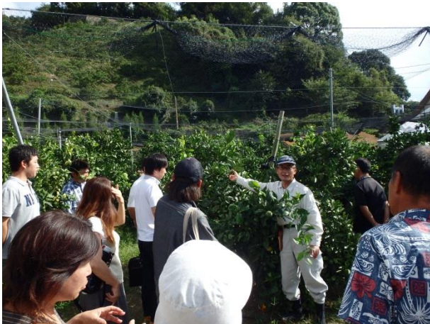
研修会に参加し品種・技術を積極的に取り入れます