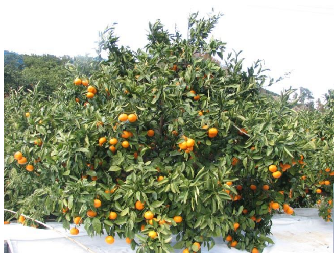
高品質安定生産に向けて努力しています