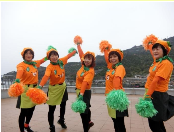
フレッシュレンジのメンバー

この活動の前提にあるのは、あくまでも生産者であるということ。みかん作りに日々励み、日本一の美味しいみかんを作ることが原則。「みかん愛」あってこそこの活動です。