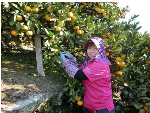
みかん山での作業