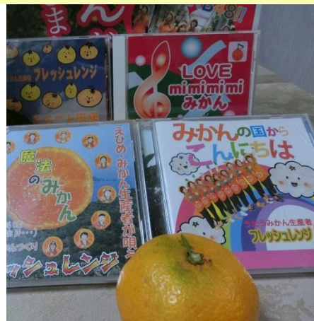
オリジナルソングCD