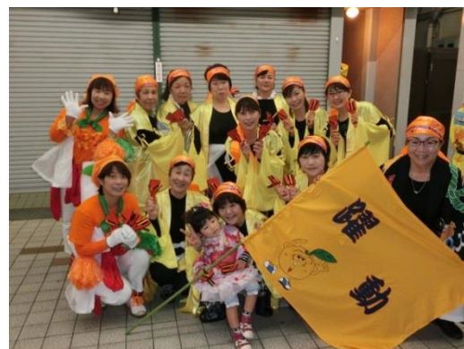
フレッシュレンジの活動