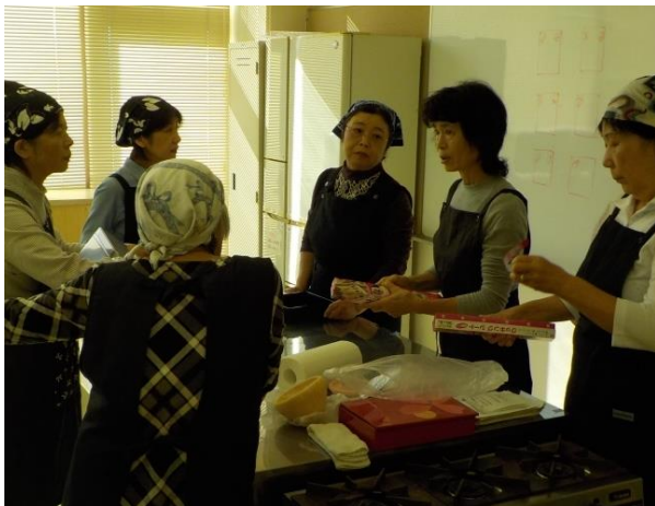
体験交流スタッフとの打ち合わせ

※「愛の地産池消レストラン」は、毎月第 4 土曜日・日曜日に営業しています。詳しくは「しまなみグリーン・ツーリズム推進協議会」のホームページ ( http://shimanami.ciao.jp ) でご確認ください。