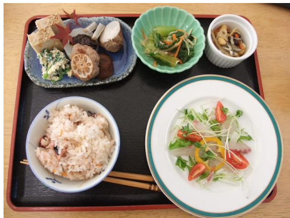
農家レストランのメニュー