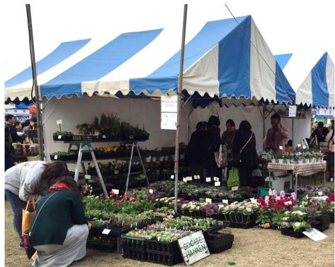
イベントへの出店