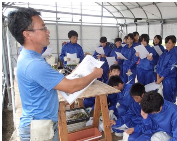
職場体験の受入れ