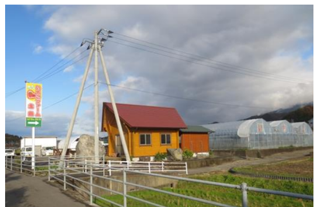
（196 号線沿いにある拠点施設“いちご庵”）