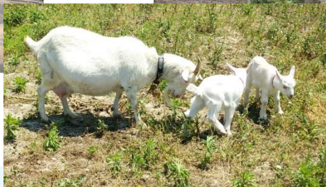
(農園のアイドルたち)