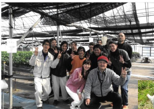
(研修生たちと共に)