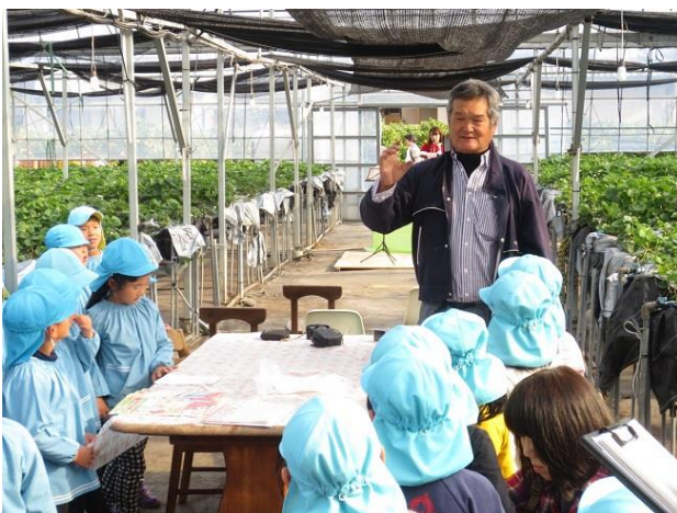
（地元保育所の園児を迎えて）

農業研修生も積極的に受入れています。県立農業大学校の学生及び特別支援学校の生徒の 農業実習の受け入れを行い、 農業に関心を持ってもらい、将来農業を目指す人が増えるよう努めています。平成 30 年には 3 名が新規就農し、イチゴ栽培に取り組んでいます。