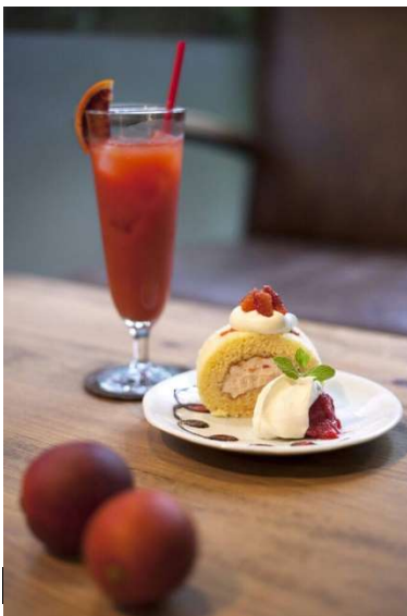
ブラッドオレンジを使ったスイーツとジュース（果汁100%）