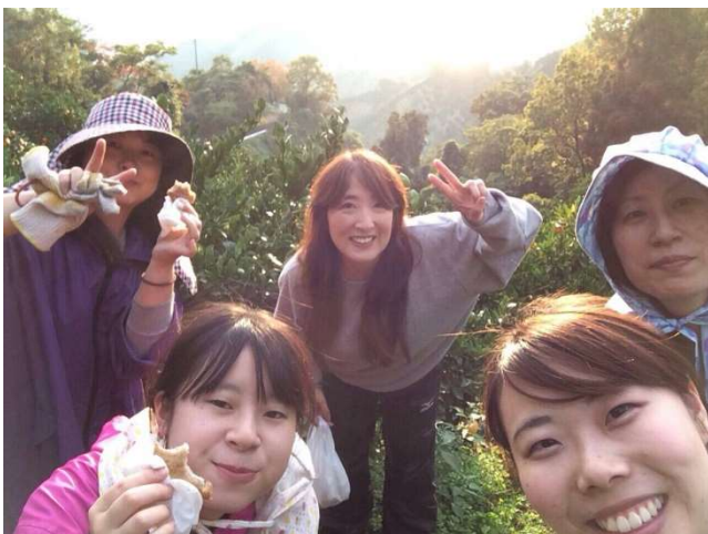
みかん畑で休憩中の研修生と園主（中央）

これからも、このゲストハウスを交流の拠点に、農業・農村の魅力を発信していきたいと思います。