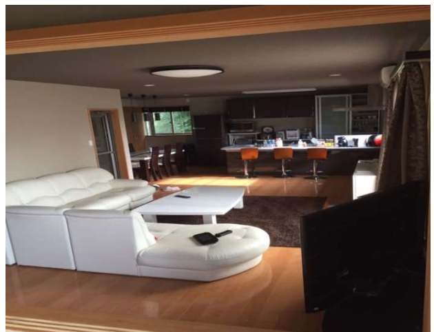
ゲストハウス自慢のリビングダイニング