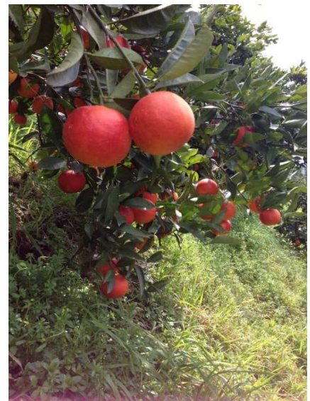
収穫前のブラッドオレンジ