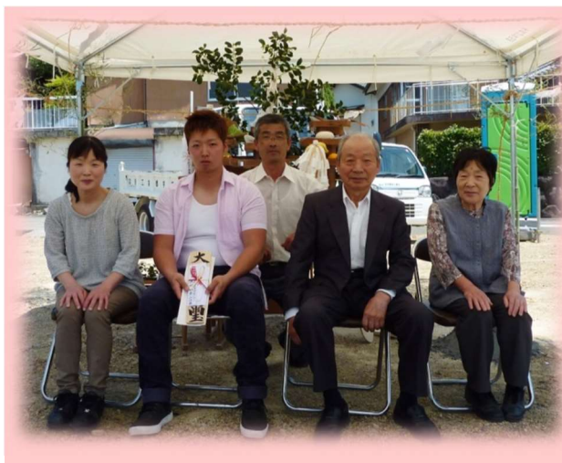
長男の新居の地鎮祭にて 家族と