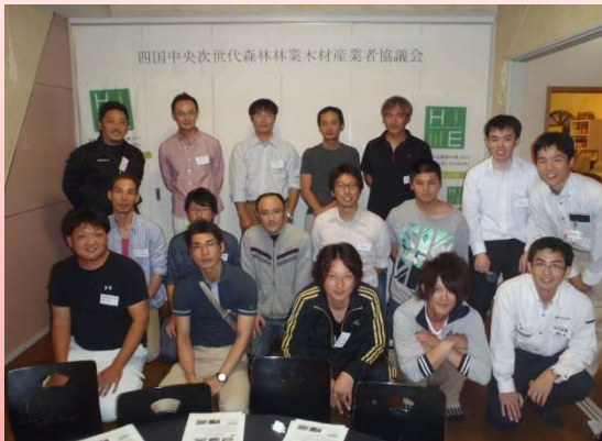
次世代会（三列目左から三人目）