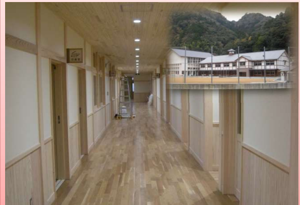
新宮小中学校木造新築校舎