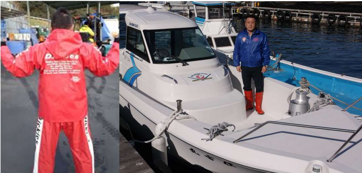
○作業ガッパ、新調だゾ！