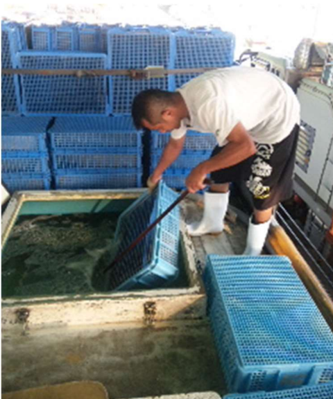
○活魚トラックへの積み込み