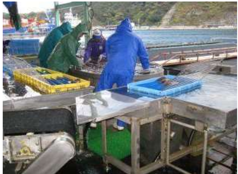
○毎朝現場での出荷の選別作業！