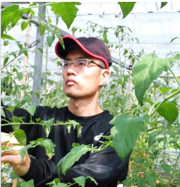
ミニトマトの整枝作業

町内の産直施設や色々な伝手を頼って、大阪などにも出荷していましたが、今は地元スーパーの直売コーナーだけに絞って販売しています。