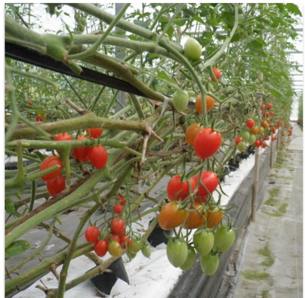
たわわに実るミニトマト