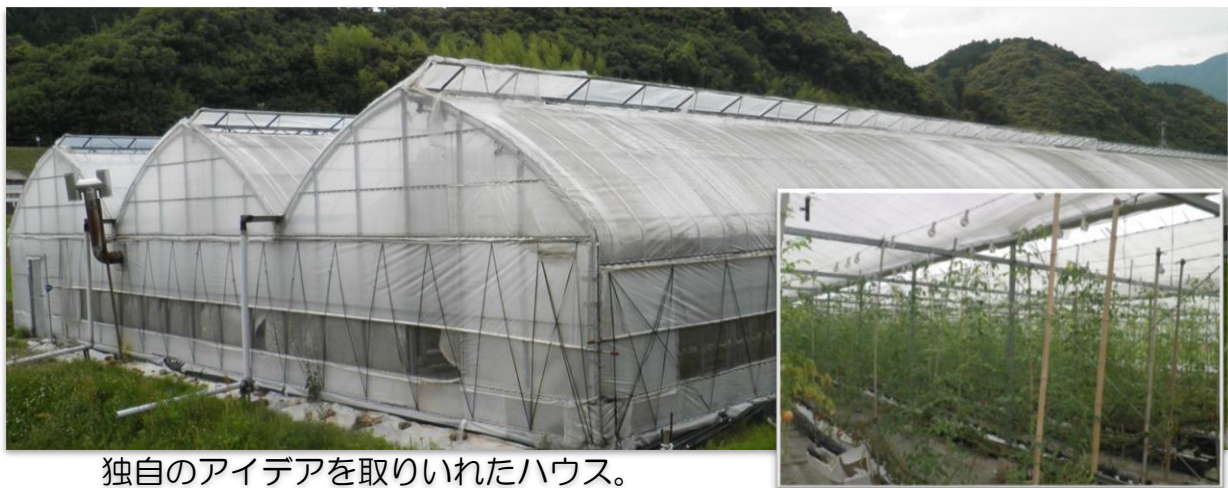
独自のアイデアを取り入れたハウス。