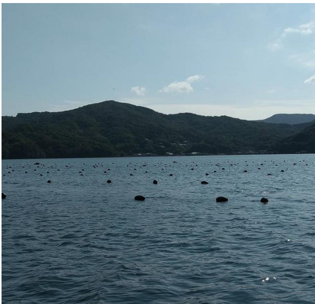
真珠を育てる豊かな漁場

現在は、「 御荘湾の真珠を日本一にする 」を理念に、いつか消費者へ日本一の真珠を届けるために、日々真珠養殖業に真剣に取り組んでいます。また、御荘湾は 若手の真珠養殖業者が多い ため、相互に連携を取り、「 御荘湾の真珠を日本一にする 」という理念を湾内全体で共有し、 共に頑張っています 。