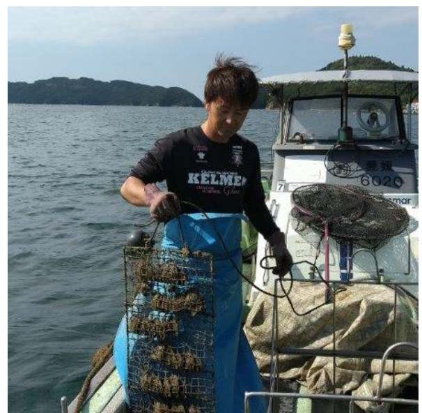
アコヤガイを引き上げて貝掃除をします