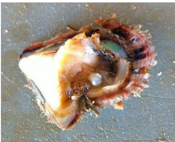
一級の真珠を取り出す喜びはひとしお