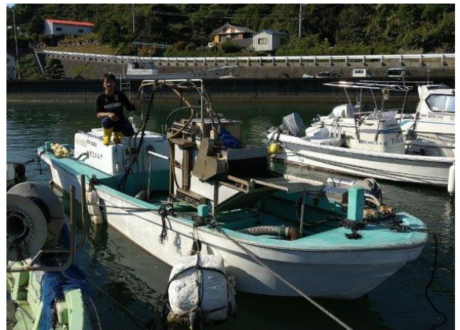
新導入したウォッシャー船（貝掃除用の漁船）