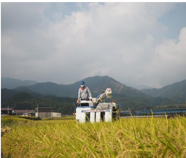
農作業（稲刈り）の様子

生産した農産物の大半は周ちゃん広場等の産直市に出荷しており、中でも有機 JAS に準じて栽培した“あまにんじん”は人気があり午前中で売り切れてしまうこともあります。また、出荷先が産直市であるため、子供たちとの休みを合わせることに苦労しましたが、作業効率を上げることで、収量を落とさずに子供や家族と向き合える時間を作るよう努力しました。