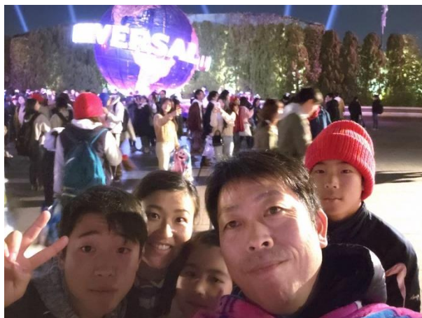
家族で楽しく旅行