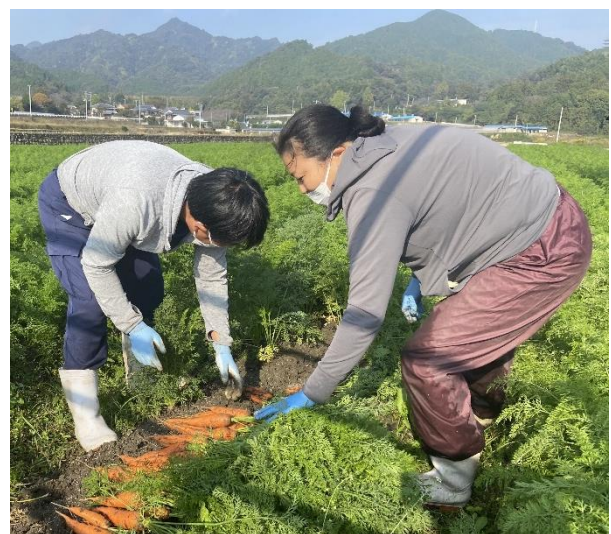
農作業（人参の収穫）の様子