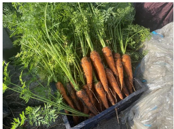
有機栽培にこだわった人参