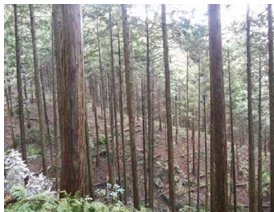
間伐施業後の林分