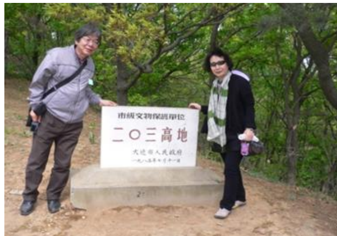
余暇を利用しての旅行