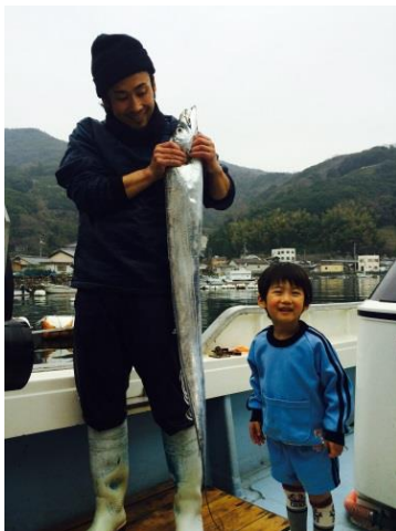
息子に釣果を自慢