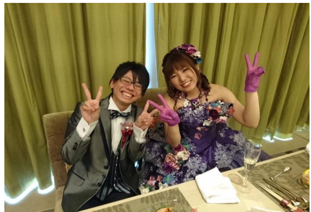
結婚式にて（平成29年6月11日）