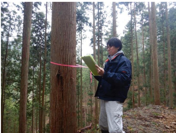
森林経営計画現地確認中

平成29年4月には、この仕事を通じて、新しいパートナーができ、ラブラブな新婚 生活♥を送っています。益々頑張らないと、「尻に敷かれる～ヤバイ！！」