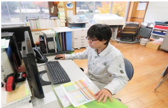
データ入力と図面作成