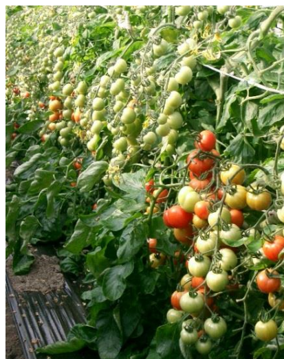
色づき始めた中玉トマト