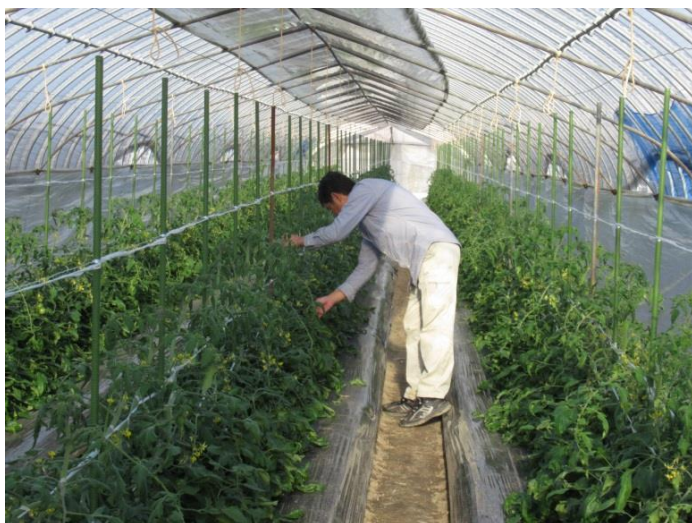
ハウス内での作業

また、作ったものを売るのではなく、売れるものを作ることを考えて、栽培に取り組むようにしています。