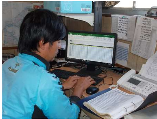
データの入力作業