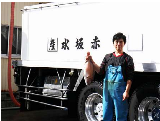
活魚トラックの前で