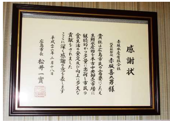
広島市長からの感謝状