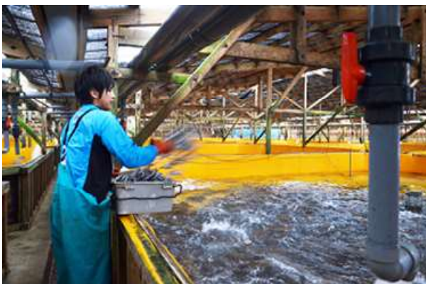
ヒラメの給餌作業

主力であるヒラメは、エサの工夫に加えて水槽内の清潔な飼育環境の維持に細心の注意を払っています。結果として、脂の乗りが良くて味が良いと出荷先では評価されていますが、手間暇かけて育ててもなかなか満足のいく価格は付かないものです。そこで当社では常に他県の相場の情報収集に尽力しており、高く売れる近隣（広島・山口・高知など）の市場や加工場に自社の活魚トラック便でタイミングを逃さず自ら持ち込むという経営戦略をとっています。平成 26 年には、魚市場への安定供給に長年貢献したことに対して広島市長より感謝状を頂きました。