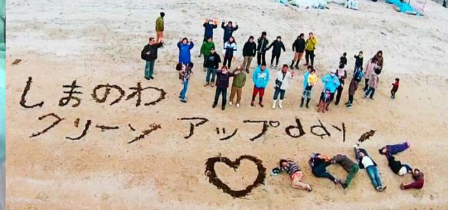
「海ゴミ」も「アート」に ビーチクリーン活動