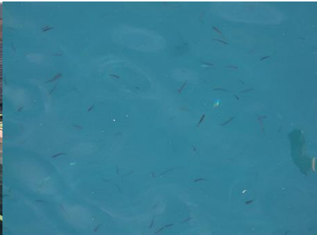
○「スマ（媛貴海）」養殖実証試験：大学や水研センターとの委託試験。<稚魚の沖出しの様子> ○「スマ」の沖出しサイズの稚魚（5月 6cm）