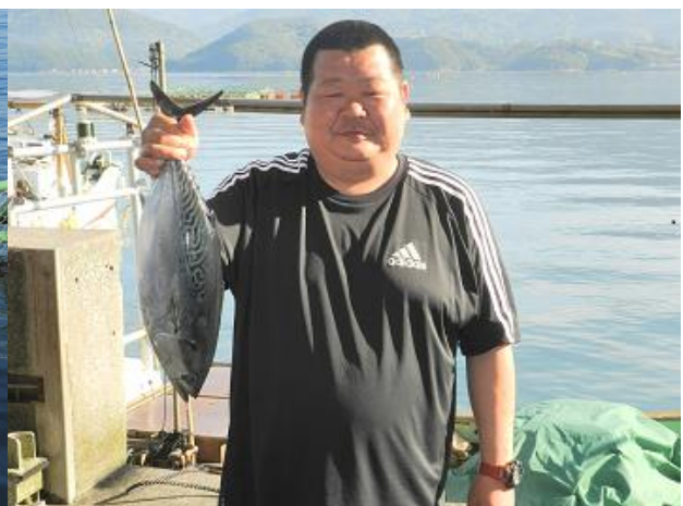
○新たな愛育フィッシュ、「伊予の媛貴海」。