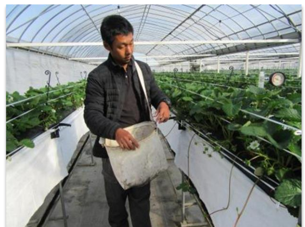
いちご管理状況、広い通路が目立ちます