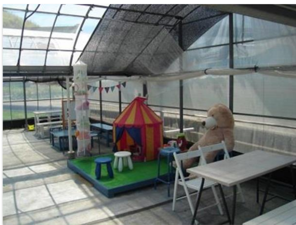
小さなお子さんが来ても対応できます

観光いちご園では多くの方が出入りしますので、薬剤散布は極力少なくすることを心がけており、平成29年には「エコえひめ」の認証を取得しています。また、通路も車いすが通れるくらい広く、高齢者や障がい者の方への配慮したいちご園しています。