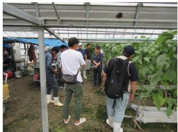
青年農業者の仲間とほ場で意見交換