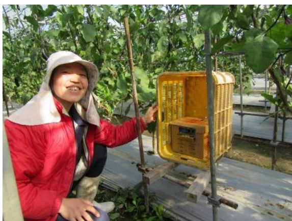
マルハナバチ導入でトーン処理軽減

花き栽培に向けて帰郷後すぐにハウス付き農地を探しましたが、取得するまでに1年以上かかりました。しかし、取得した農地では花き栽培には土壌環境が合わず野菜栽培を目指しています。