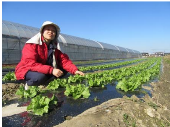
順調に生育しているレタス