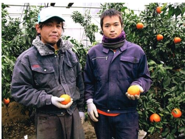
左：息子さん 右：研修生

JA や県の試験場等と連携しながら、最新の栽培技術や新品種について積極的に現地試験やほ場調査に協力し、自分の地域にあった栽培技術や新品種の導入等を積極的に進めています。