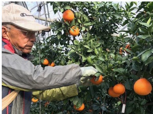
紅まどんなの収穫状況