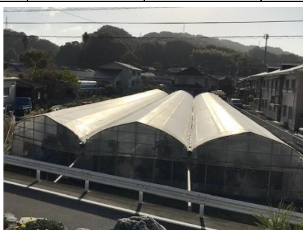
左：農大からの研修生受け入れ 右：紅まどんな施設