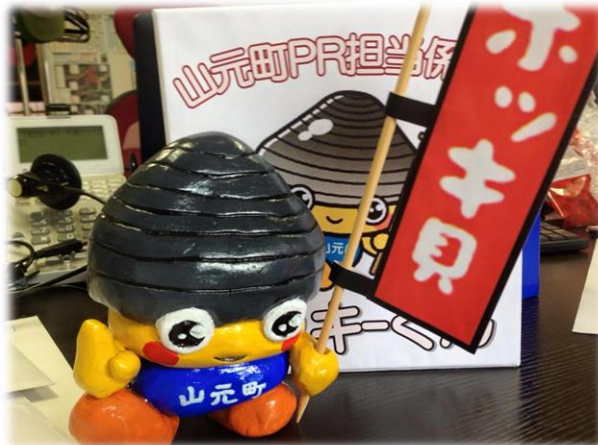
ホッキーくん以来の新作を創らねば！