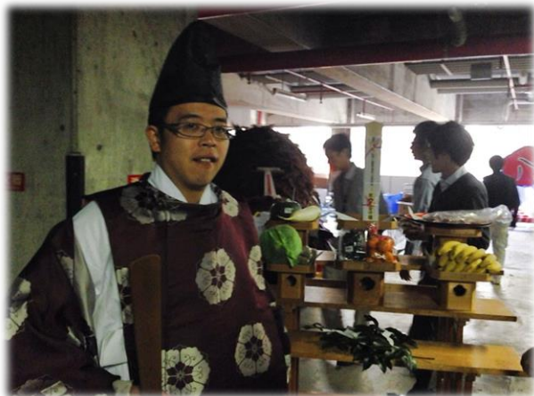
ときどき神主で地域繁栄を祈禱します